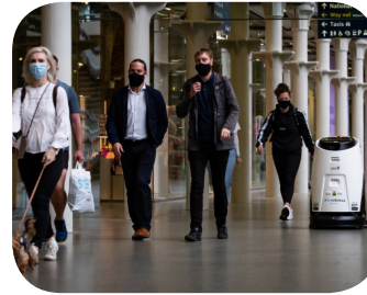
למרכזים מסחריים וקניונים